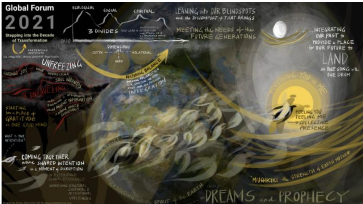
Trazado visual por Kelvy Bird en el Foro Global 2021

la idea al impacto en el ecosistema en un período de cuatro meses. (Esto involucró a miles de partes interesadas y miembros de equipos centrales en el camino).