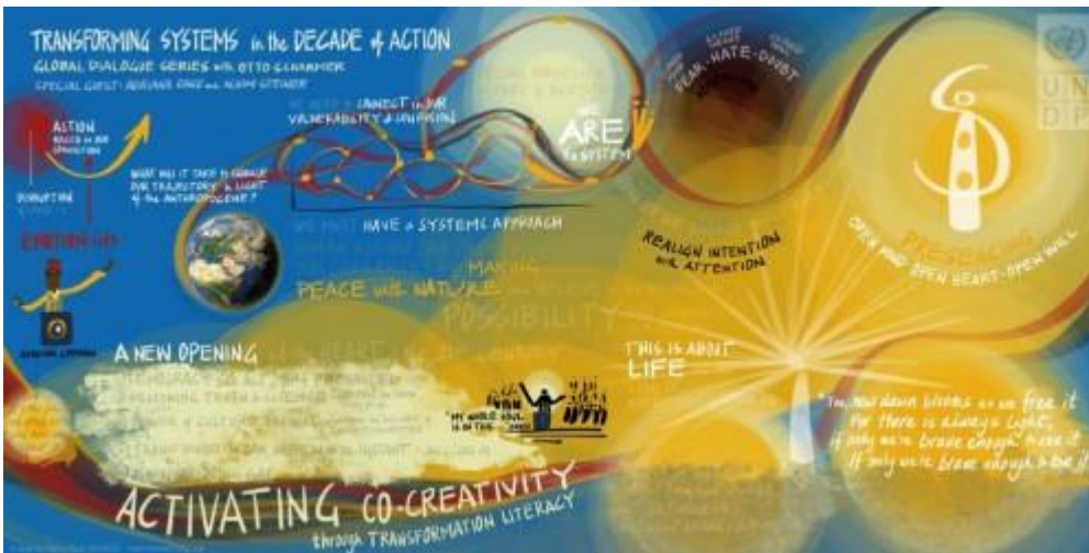
Trazado Visual en las Naciones Unidas por Kelvy Bird